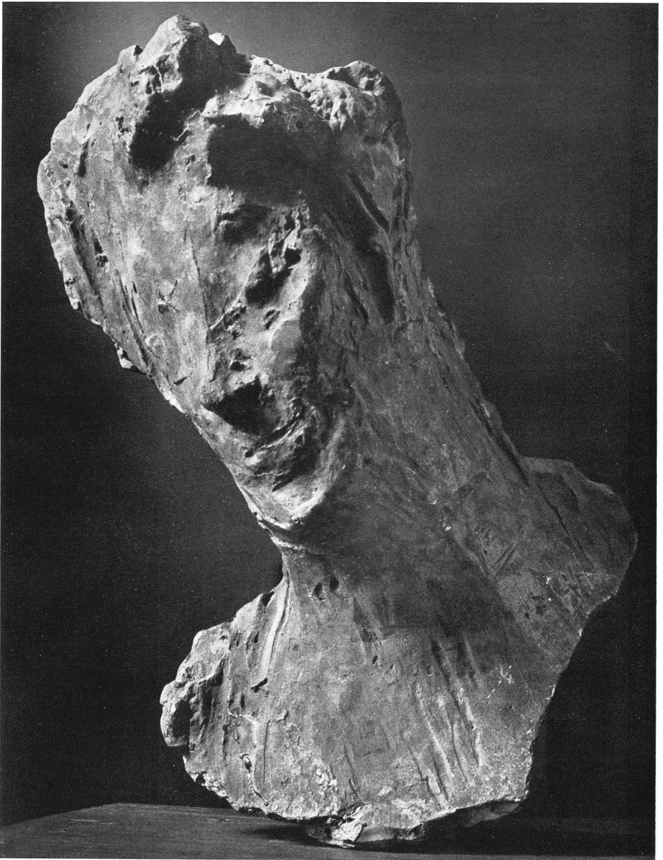
Medardo Rosso, Yvette Guilbert, 1894. Wachs. Galleria d'Arte Moderna, Rom