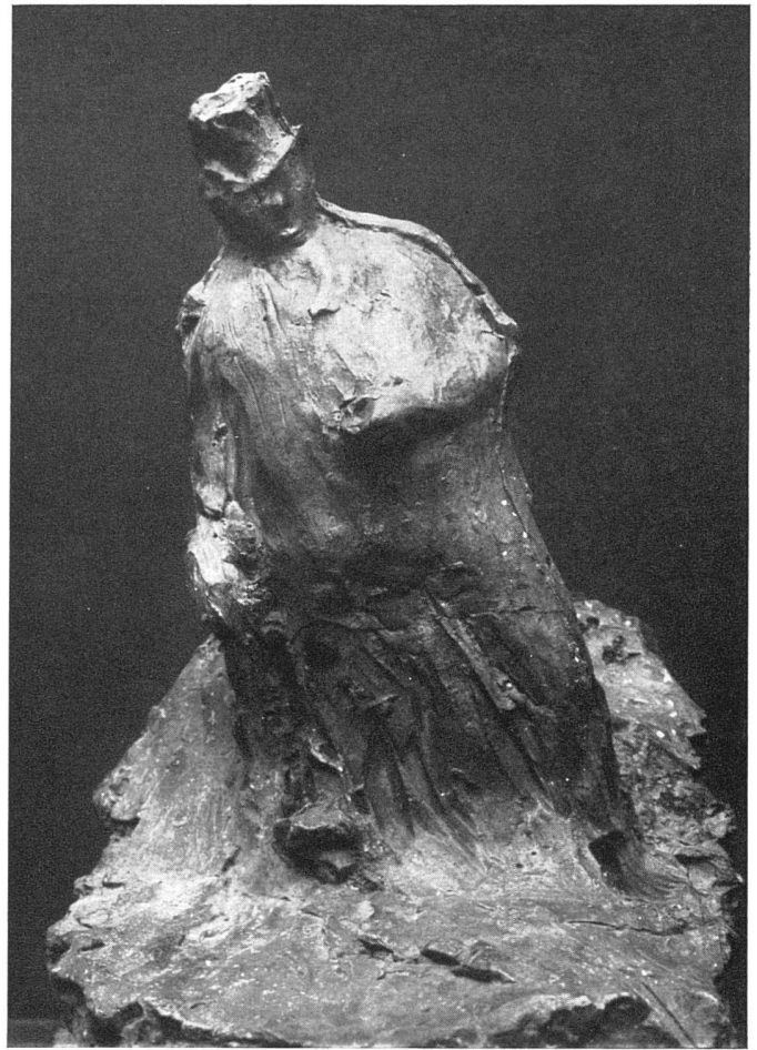
Medardo Rosso, Der Buchmacher , 1894. Wachs. Sammlung Mattioli, Mailand | Le bookmaker . Cire | The Bookmaker . Wax