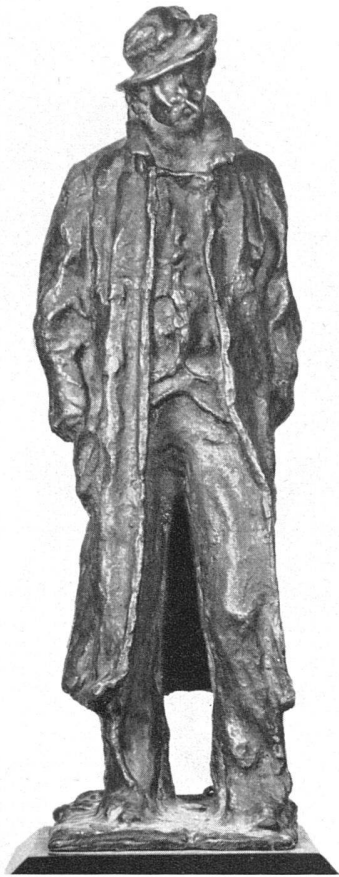
Medardo Rosso, Der Straßensänger (El Cantant a Spass) , 1882. Bronze. Galleria d'Arte Moderna, Rom | Le chanteur des rues . Bronze | The Street Singer . Bronze