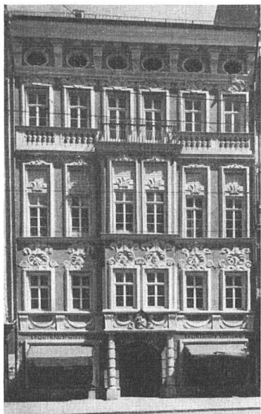
Innsbruck. Palais Trojer-Spaar (um 1682). Das frühbarocke Stadtpalais des Architekten Johann Martin Gumpp d. Ae. war im Erdgeschoß zu Geschäftszwecken mehrfach umgebaut worden. Der jüngste Umbau (Projekt: Tiroler Landesamt für Denkmalpflege) stellte die Portalsäulen wieder her und schuf Schaufenster, die sich der Fassade besser einfügen.

eine alte Dame in einem unechten Kleid mit neuer Kopfbedeckung. – Sehr viel mutiger als die Bauverwaltung waren einige Banken und Versicherungsgesellschaften. Vor allem die Hochbauten der Landesversicherungsanstalt und der National-Versicherung atmen den Geist unserer Zeit, bescheiden in die Vorstädte zurückgesetzt. Es ist leicht, zu kritisieren, und gewiß, daß es keine Lösung gibt, die eine ein-