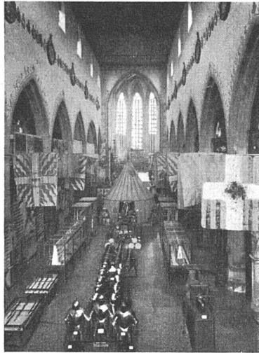
Historisches Museum Basel in der Barfüßerkirche. Alte Aufstellung