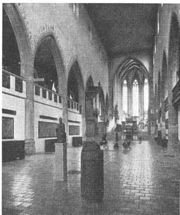
Das Mittelschiff nach der Neuaufstellung.

grauen Kunststeinboden in sehr schöner Weise. Weiter wurden die unteren Treppenstufen des Aufgangs zum Chor in der Mitte unterbrochen und in die entstandene Lücke ein kleiner Tessiner Altar gesetzt, der den Einblick in den Chor nicht verstellt, aber doch an die Zäsur erinnert, die hier einstmals der Lettner bildete. Gleichzeitig weist diese Lücke in den Choraufgangsstufen auf einen Plan hin, der in einer späteren Renovations-Etappe ausgeführt werden soll: die Krypta zu öffnen, um hier eine zweite Schatzkammer für die prachtvollen Gold- und Silberschmiedearbeiten des restlichen Münsterschatzes und des Zunftsilbers zu schaffen, die heute noch ein unübersichtlich gedrängtes Dasein in der Sakristei fristen müssen. Auch im Chor, in dessen Mitte der schöne Calanca-Altar nach wie vor steht, wurde durch die Renovierung Platz und Luft geschaffen – hier vor allem für die schönsten der mittelalterlichen Plastiken. Mit Bedacht wurden Altäre und Pre-