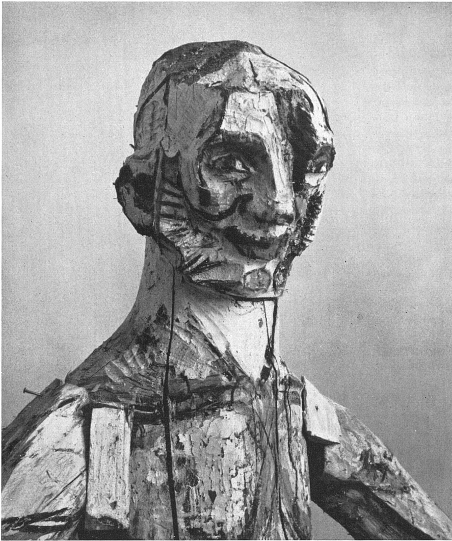
Emilio Stanzani, Pan, 1953/54. Holz, bemalt / Pan; bois peint / Pan, painted wood