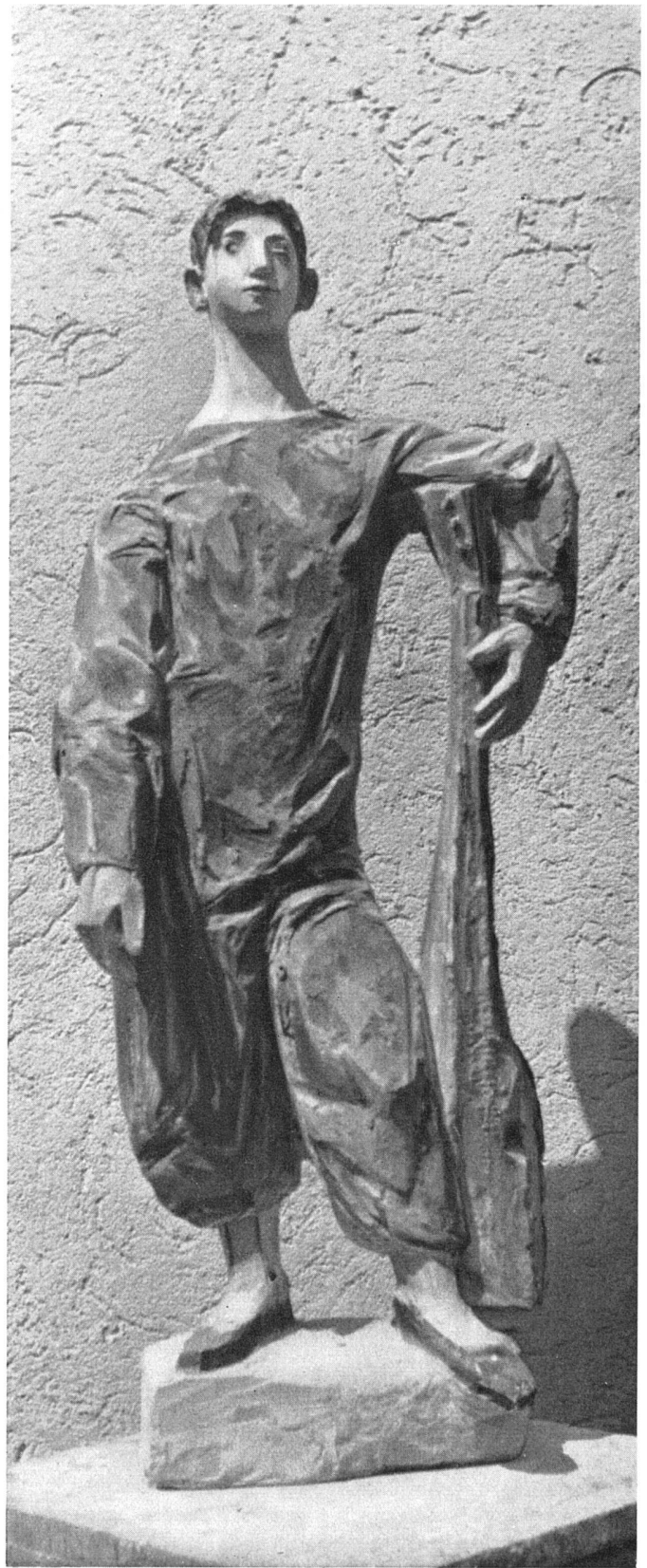
Emilio Stanzani, Filippo, 1953. Stuck, bemalt / Filippo; stuc peint / Filippo, painted stucco

Die Gefahr des Karikaturistischen war dabei groß. Er verfiel ihr, als ein im Grunde melancholischer Romantiker, nicht. Man darf behaupten, daß hier wie bei Toulouse-Lautrec eine schöpferische Figur des Rampenlichts durch das Medium der bildenden Kunst registriert und zum Werk erstarrt ist.