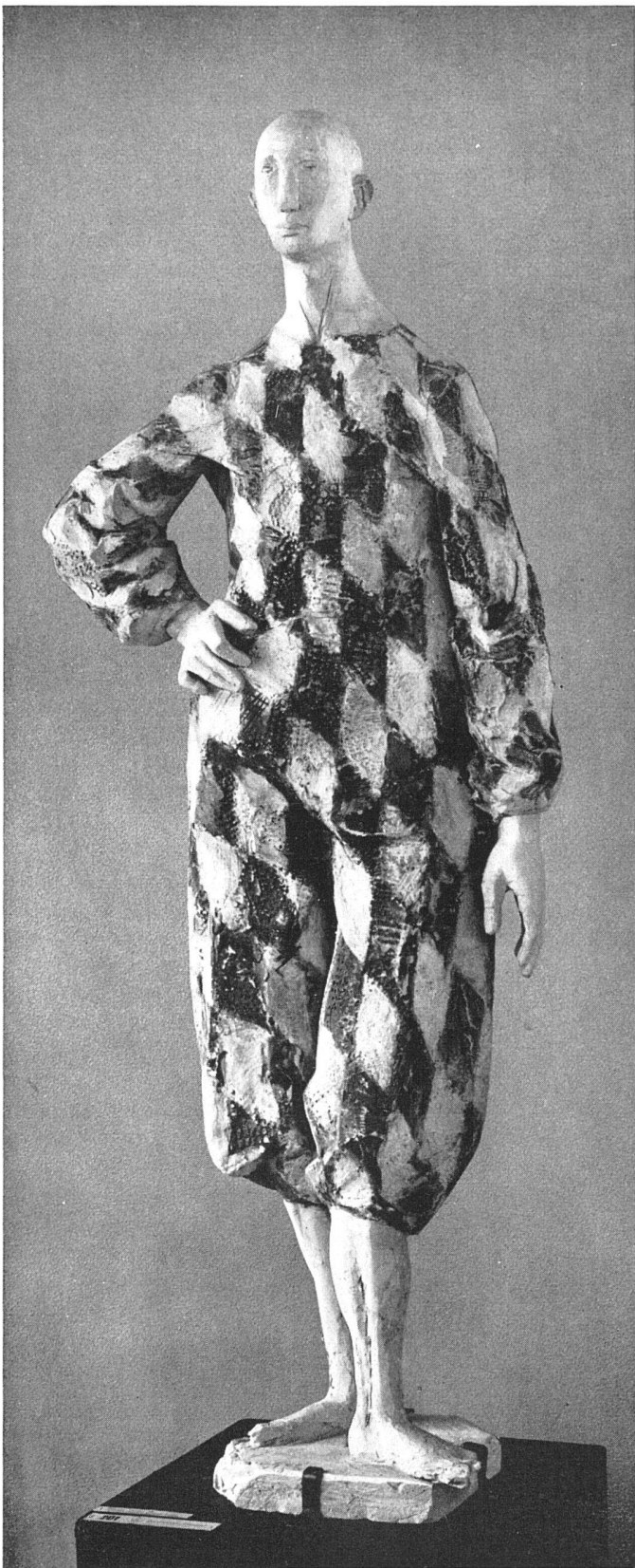
Emilio Stanzani, Arlecchino in attesa , 1949/50. Stuck, bemalt. Depositum der Stadt Zürich im Kunsthhaus Zürich | Arlequin; stuc peint / Harlequin waiting, painted stucco

Maskerade einer oder mehrerer Schulen zutage. Mit Beeinflussung von hier und dort hat dies wenig zu tun. Gegen diese sind Künstler, die in erster Linie nicht gehirnmäßig arbeiten, weitgehend gefeit.