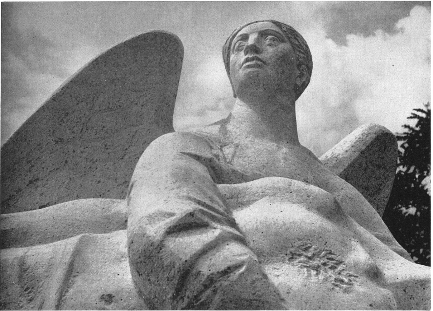
Emilio Stanzani, Pietà (Detail) , 1947/50. Cristallina-Marmor. Friedhof Höngg / Pietà (détail) ; marbre / Pietà (détail) , marble