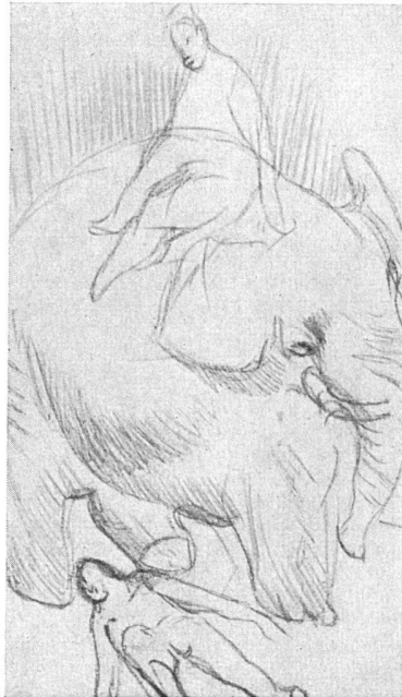
Paul Cézanne, Der Elefant . Zeichnung. Sammlung Graindorge, Lüttich