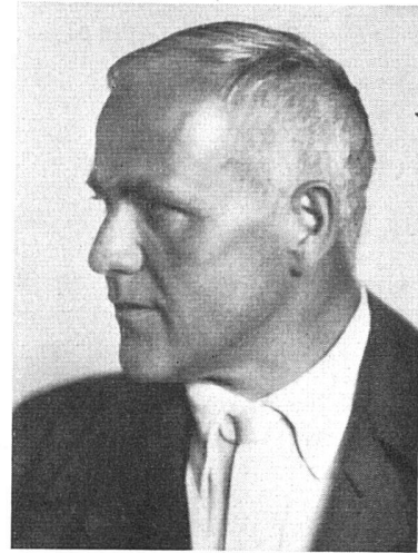
Architekt Hannes Meyer †