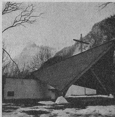
Pfadfinder-Feldkapelle in Kandersteg Architekt: Werner Peterhans, cand. arch., Bern