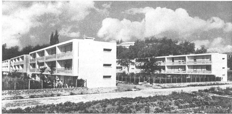
Angestelltenhäuser der Olivetti-Werke in Ivrea. Architekten: L. Figini u. G. Pollini

gangenen Geschäftsjahr recht lebhaft gewesen.