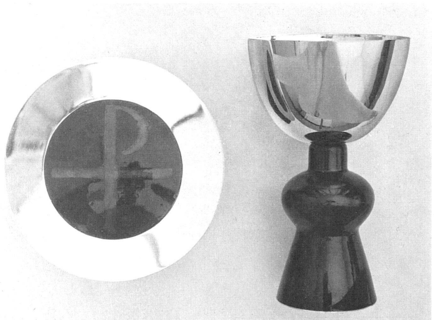
Patena und Kelch, Silber vergoldet | Plat et bocal, en argent doré | Plate and chalice, gilded silver