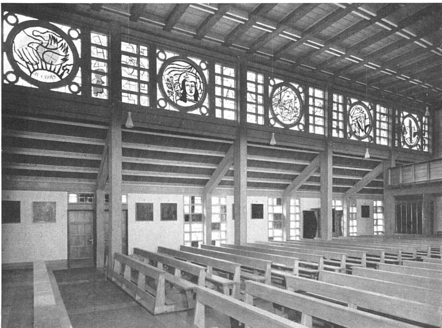
Blick zum rechten Seitenschiff / Bas-côté droit / View of the right aisle Photo: Walter Dräger, Zürich

bildet und den Innenraum hell und luftig macht. Zuerst wurden die 8,25 m hohen vorgefertigten Hauptpfeiler als Stützen für das Dachgebälk aufgerichtet. Die am Platz gegossene Versteifungsbinder und die Tragkonstruktion der Seitenschiffe verstreben sie. Der Beton wurde gestockt. Für die Holzdecke des Mittelschiffs wurden die alten Balken freigelegt.