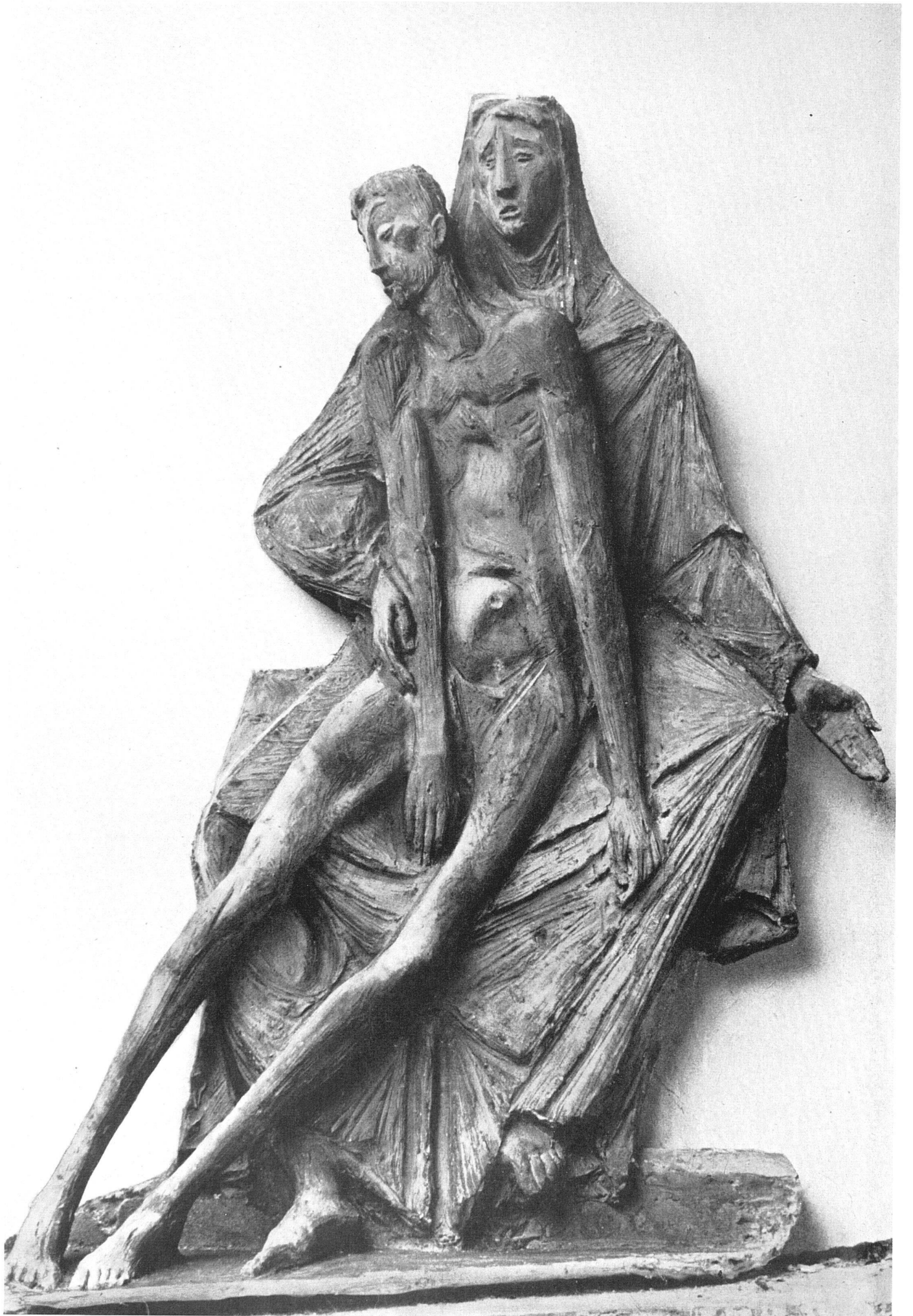
Remo Rossi, Pietà, 1954. Bronze