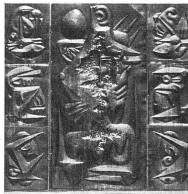
Wostan, Solitude. Getriebenes Blech . Salon de la Jeune Sculpture, Paris

aus intensivem Schaffen und Bauen. Die sehr begabte und eigenwillige Baukünstlerin hinterläßt ein reiches Lebenswerk an privaten Wohnhäusern, Mietbauten, Hotels u. a. m. Wir werden noch auf Persönlichkeit und Werk der Verstorbenen zurückkommen. a. r.