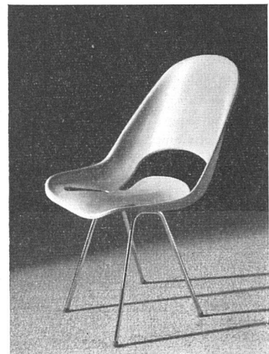
Gartenstuhl mit Schale aus Stellafort. Entwurf: W. Frey SWB, Innenarchitekt, Basel

vorzügliche Formbarkeit der Phantasie des Stuhlzeichners freie Entwicklung ermöglicht, kann sich das Bild des modernen Gartenmöbels verfeinern.