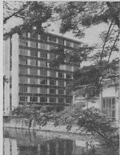
Geschäftshaus «Zur Bastei» in Zürich Architekt: Werner Stücheli BSA/SIA, Zürich

Geschäftshaus «Zur Bastei» in Zürich. Architekt: Werner Stücheli BSA/SIA, Zürich PTT-Garagen und TT-Magazine in St. Gallen. Ausführung: Ernest Brantschen, Arch. BSA/SIA, St. Gallen Erweiterung der Central-Garage in St. Gallen. Architekt: Ernest Brantschen BSA/SIA, St. Gallen DieBahnsteigdächer in Winterthur-Grüze, von Hans Hilfiker Bauten im Werden: Verwaltungsgebäude der Basler Transport-Versicherungsgesellschaft in Basel. Architekt: Hermann Baur BSA/SIA, Basel Geschäftshaus an der Heuwage in Basel. Architekt: Arnold Gfeller, Basel Kunstwerke im Stadtsptial Waid in Zürich Plastik von Franco Annoni Drei Briefe Wassily Kandinskys