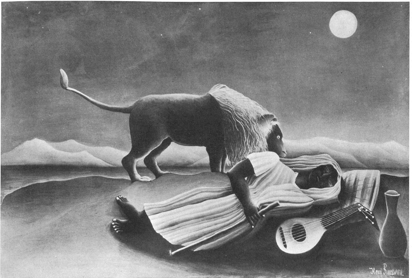
Henri Rousseau, La bohémienne endormie , 1879 | The Sleeping Bohemian . The Museum of Modern Art, New York. Mrs. Simon Guggenheim Fund