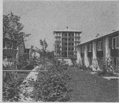
Siedlung In der Au in Zürich

Siedlung In der Au in Zürich. Architekten: Cramer+Jaray + Paillard SIA, Zürich