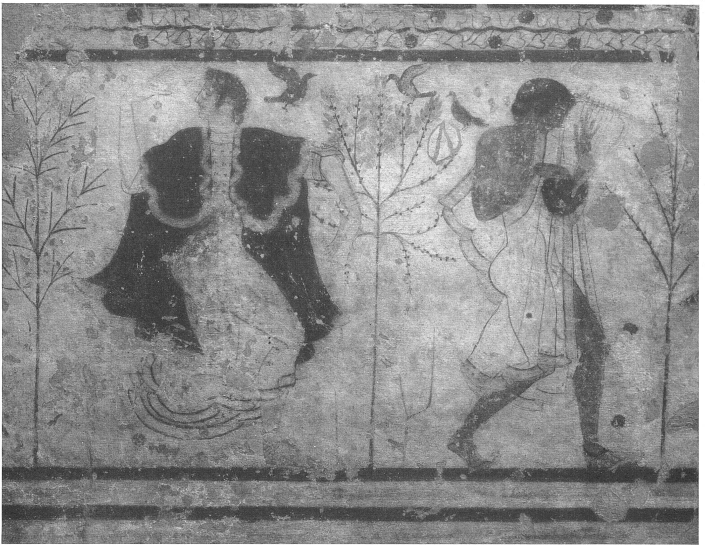
Tänzer und Tänzerin, von der rechten Seitenwand | Danseur et danseuse (paroi droite) | Dancers on the right side-wall

schen Reiches von Kiew verglichen. Die Wikinger, die es gründeten, brachten, wie die Etrusker, keine Künstler mit; aber aus der neuen gesellschaftlichen Ordnung und dem byzantinischen Erbe entstand die Synthese, die wir russische Kunst nennen.