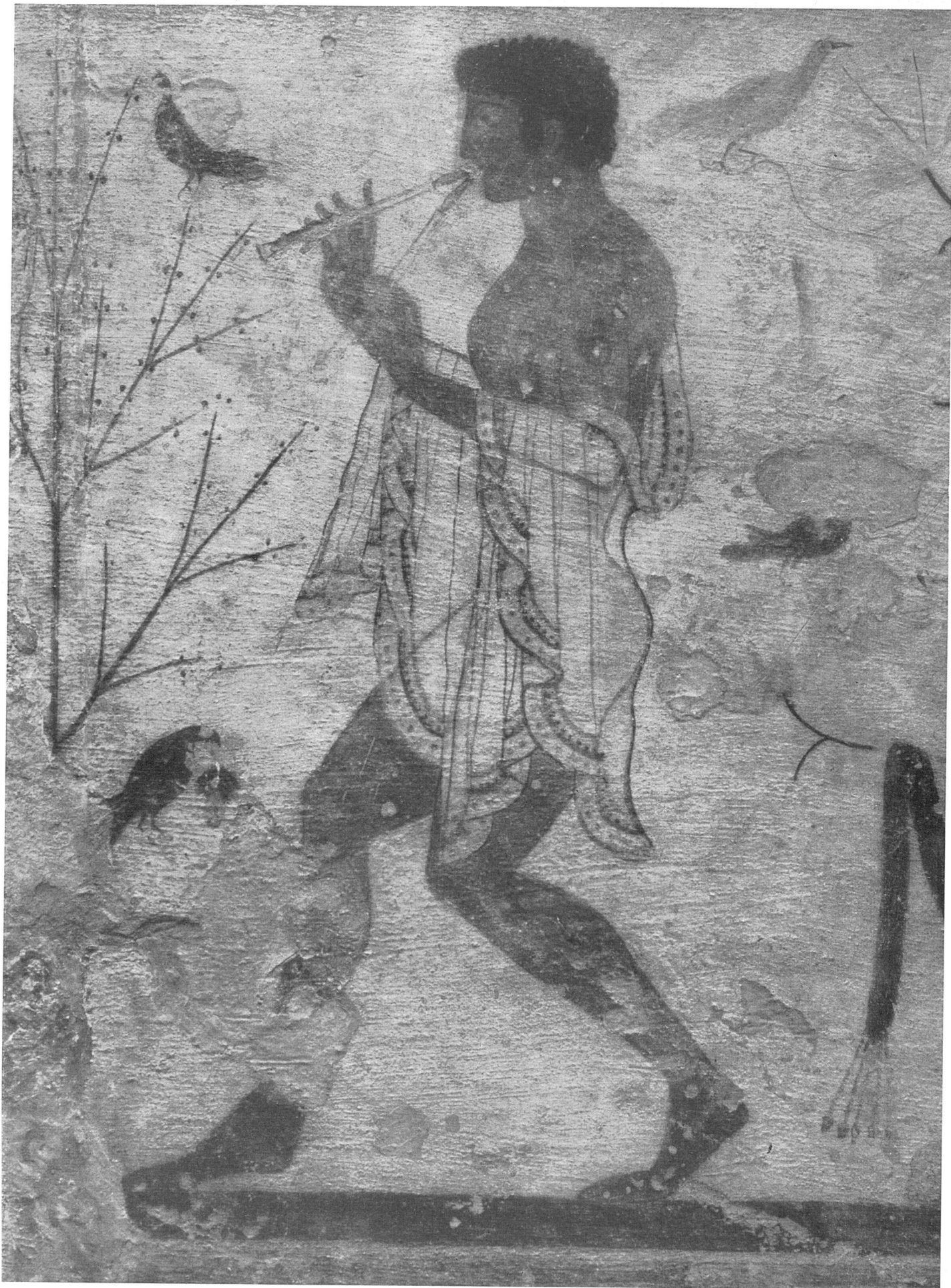
Flötenspieler, von der rechten Seitenwand | Joueur de flûte (paroi droite) | Flutists on the right side-wall