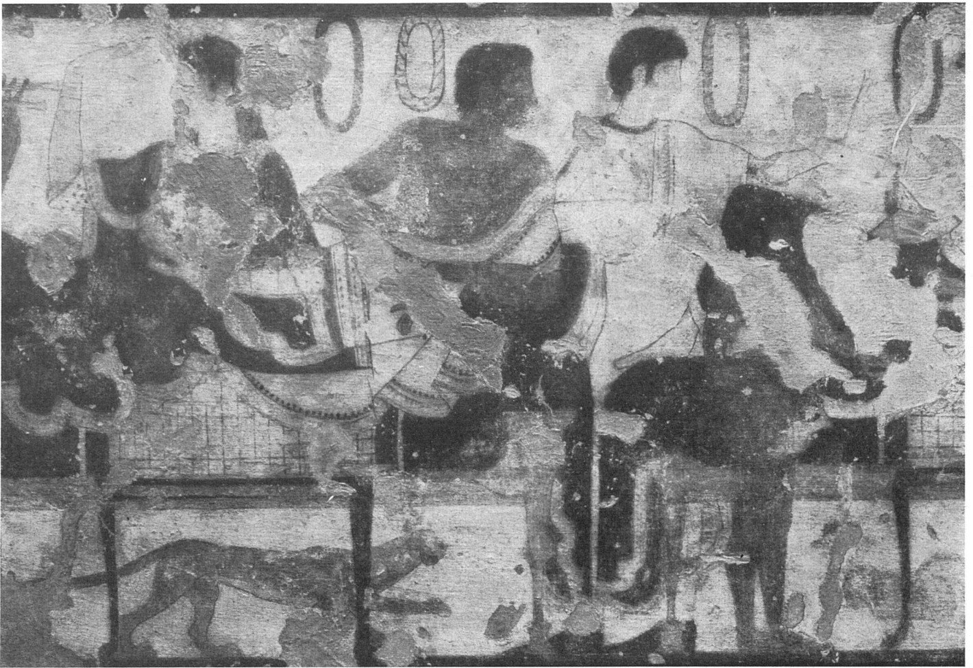
Bankettszene, aus der Stirnwand | Scène de banquet (paroi médiane) | Banquet scene from the front wall

nach und nach zu zerstören. Deshalb hat das ausgezeichnete römische Istituto dei Restauri die Gemälde zweier der schönsten Gräber auf Leinwand übertragen und im Museum von Tarquinia ausgestellt. Die «Tomba del Triclinio», das Grab des Festmahls, bekommen wir zur Zeit in Zürich zu sehen. Walter Dräyers schöne Aufnahmen, die wir hier wiedergeben dürfen, sollen auf die Bedeutung dieses Ereignisses aufmerksam machen.