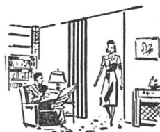
Ihr Heim Votre home