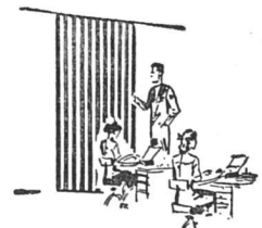
Im Büro Au bureau

Erfahrenes Fachpersonal für Beratung und Offerte, sowie Spezialprospekt und Referenzliste stehen jederzeit zu Ihrer Verfügung.