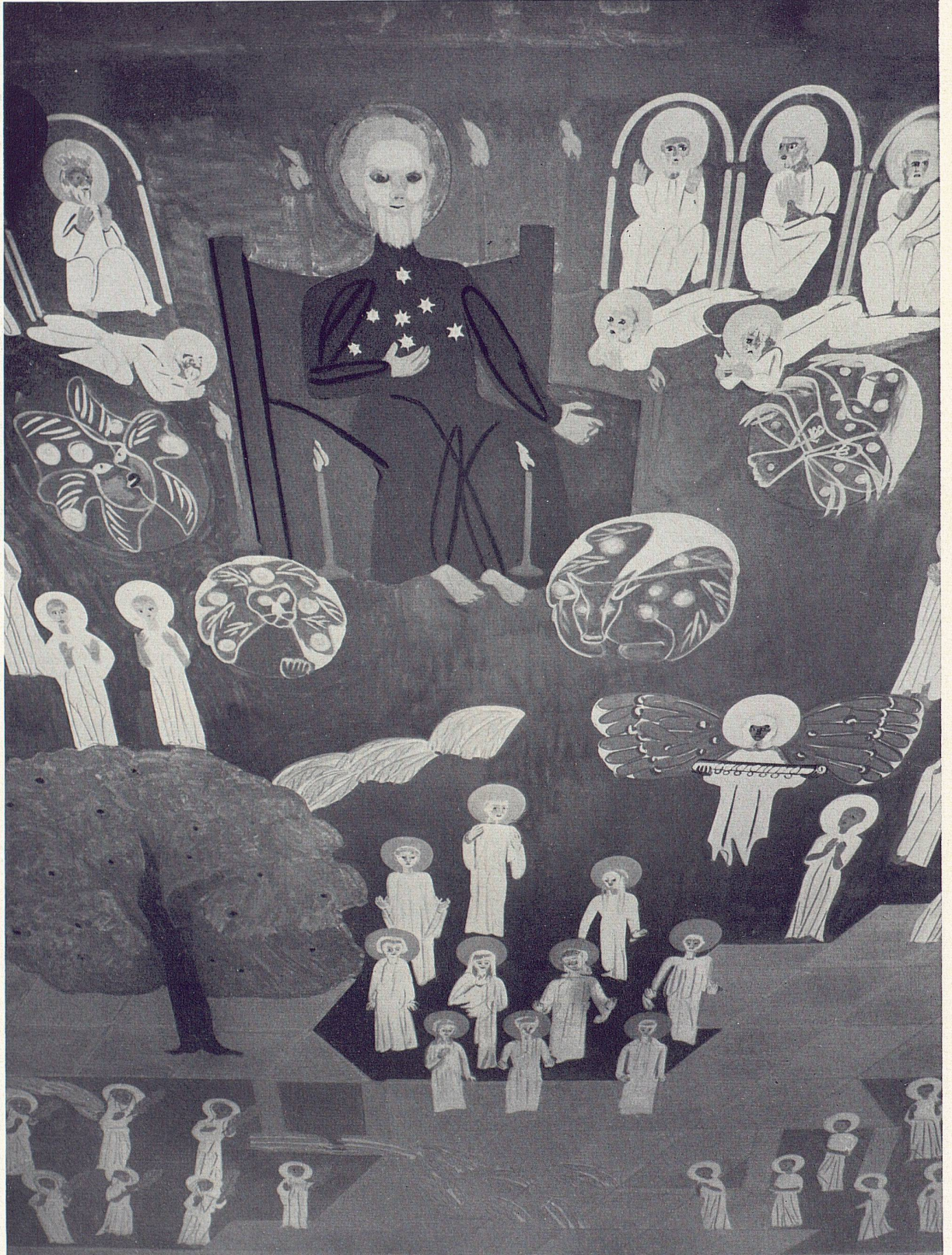
4 Ferdinand Gehr, Das ewige Jerusalem. Deckengemälde in der Maihof- kapelle in Luzern La Jérusalem céleste. Plafond peint de la chapelle Maihof, Lucerne The New Jerusalem. Ceiling painting in the Maihof Chapel in Lucerne