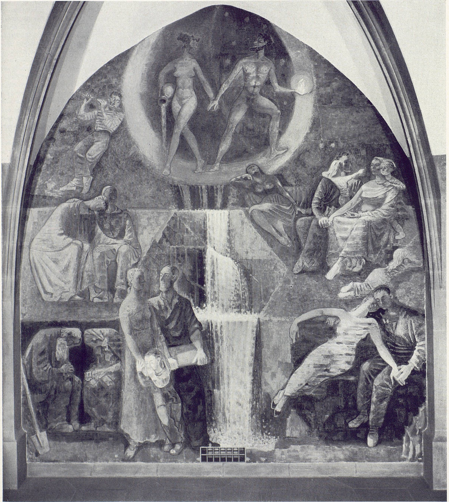
5 Fritz Pauli, Mann und Frau. Rechtes Feld der Rückwand Le couple; partie droite du mur postérieur Man and Woman, Right section of rear wall