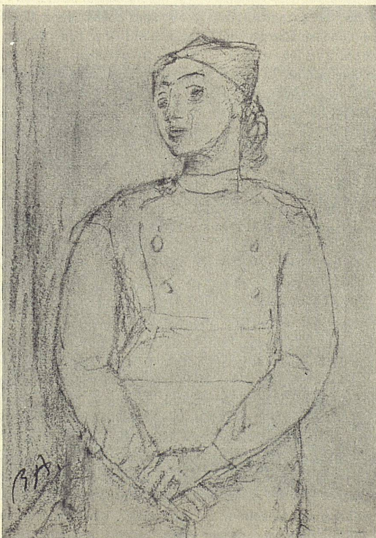
René Auberjonois, Studie für «La Parade». Bleistift

Die schweizerische Künstlerschaft hat am 11. Oktober ihren dritten großen Verlust dieses Jahres erlitten: nach Geiser im April und Dietrich im Juni starb an diesem Tage in Lausanne René Auberjonois. Er hatte kurz vorher, am 18. August, seinen 85. Geburtstag gefeiert. Doch trotz diesem hohen Alter wird es wie bei Geiser, wie bei Dietrich einer Gedächtnisausstellung bedürfen, bis die schweizerische Allgemeinheit sich seiner ganzen Größe bewußt wird. In einem weitgespannten Kreise von Kennern – Künstlern, Schriftstellern, Kritikern, Sammlern – galt Auberjonois