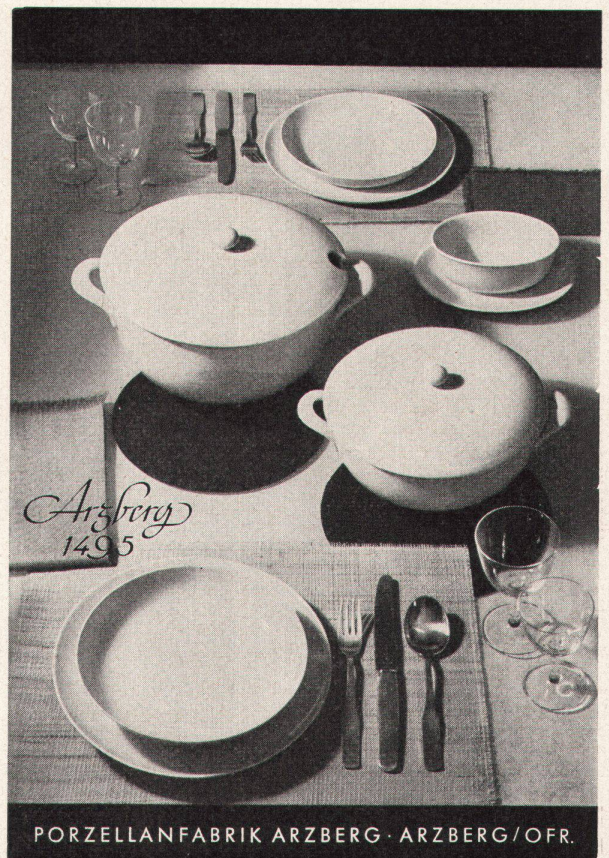
PORZELLANFABRIK ARZBERG · ARZBERG/OFR.

Bezugsquellen durch Keragra GmbH, Talstraße 11, Zürich (051) 23 91 34