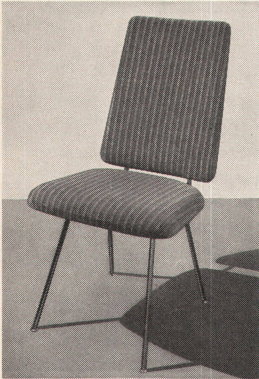
Modell 586 ges. gesch.

Altorfer AG Abt. Metallmöbel Zürich 1 Löwenstraße 32 Telephone (051) 25 07 47