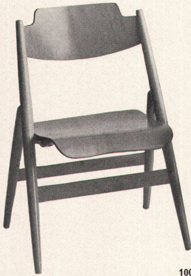
Entwurf: Prof. Eg. Eiermann