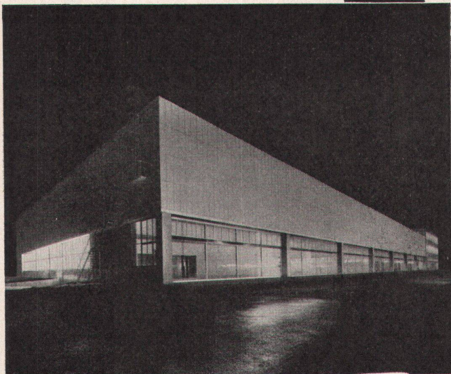
General Motors Biel

ein gutes CTW Flachdach: Feuerschutz, thermische Isolation, Wasserdichte, lange Lebensdauer, keine Unterhaltskosten