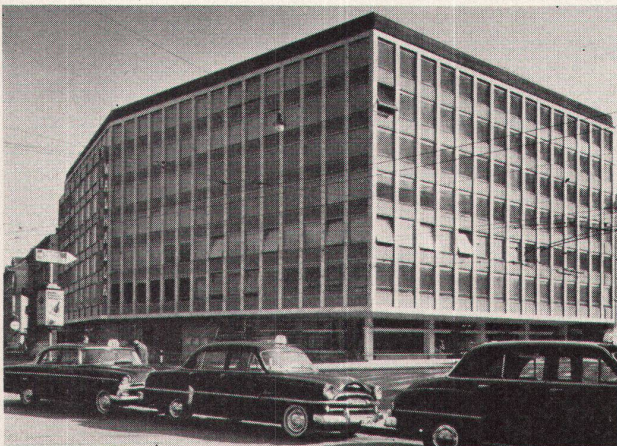
1 Das neue Hotel Walhalla in St. Gallen

Die alte «Walhalla» ist abgebrannt; wir haben eine neue erhalten, und es wäre heute müßig, dem Vergangenen noch Tränen nachzuweinen. Hingegen steht im Herzen der Stadt Zürich ein Gebäude aus der gleichen Zeit, das in seinen alten Tagen plötzlich nochmals aktuell geworden ist. Die alte Fleischhalle an der Limmat unterhalb des zürcherischen Rathauses bildet ein altes Sorgenkind der Baubehörden. Erstens verunziert sie laut öffentlicher Meinung die schöne Limmat, zweitens verhindert sie einen flüssigen Verkehr auf dem Limmatquai, und drittens hat sie ihre Aufgabe als zentraler Fleischmarkt der Stadt längst verloren. Daß sie heute immer noch steht, verdankt sie allein dem Umstand, daß einige Kuttlerieien ihr verbrieftes Recht besaßen, an dieser Stelle ihre von vielen verschmähte, von wenigen begehrte Spezialität feilzuhalten. Nun ist es den Bemühungen der Behörden endlich gelungen, auch für den letzten Kuttlermeister ein Lokal an anderer Stelle aufzutreiben, und dem Abbruch der Fleischhalle stände damit nichts mehr im Wege. Auch sind die Pläne für die neue Straßenführung und für eine diskrete Bedürfnisanstalt mit Wartehalle an Stelle des alten Gebäudes bereits vorhanden. Und nun, in diesem längst er-