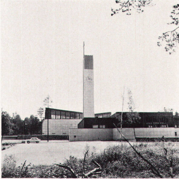
3 Die Anlage vom Norden Eglise et annexes vues du nord Assembly view from the north