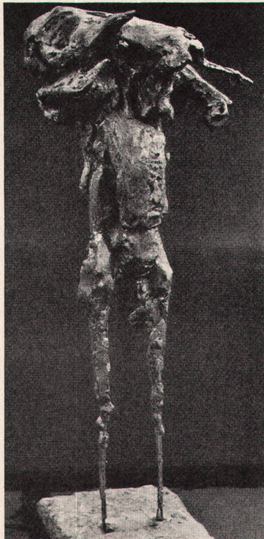
4 Barbara D. Chase, Man and Goat, 1960. Gips