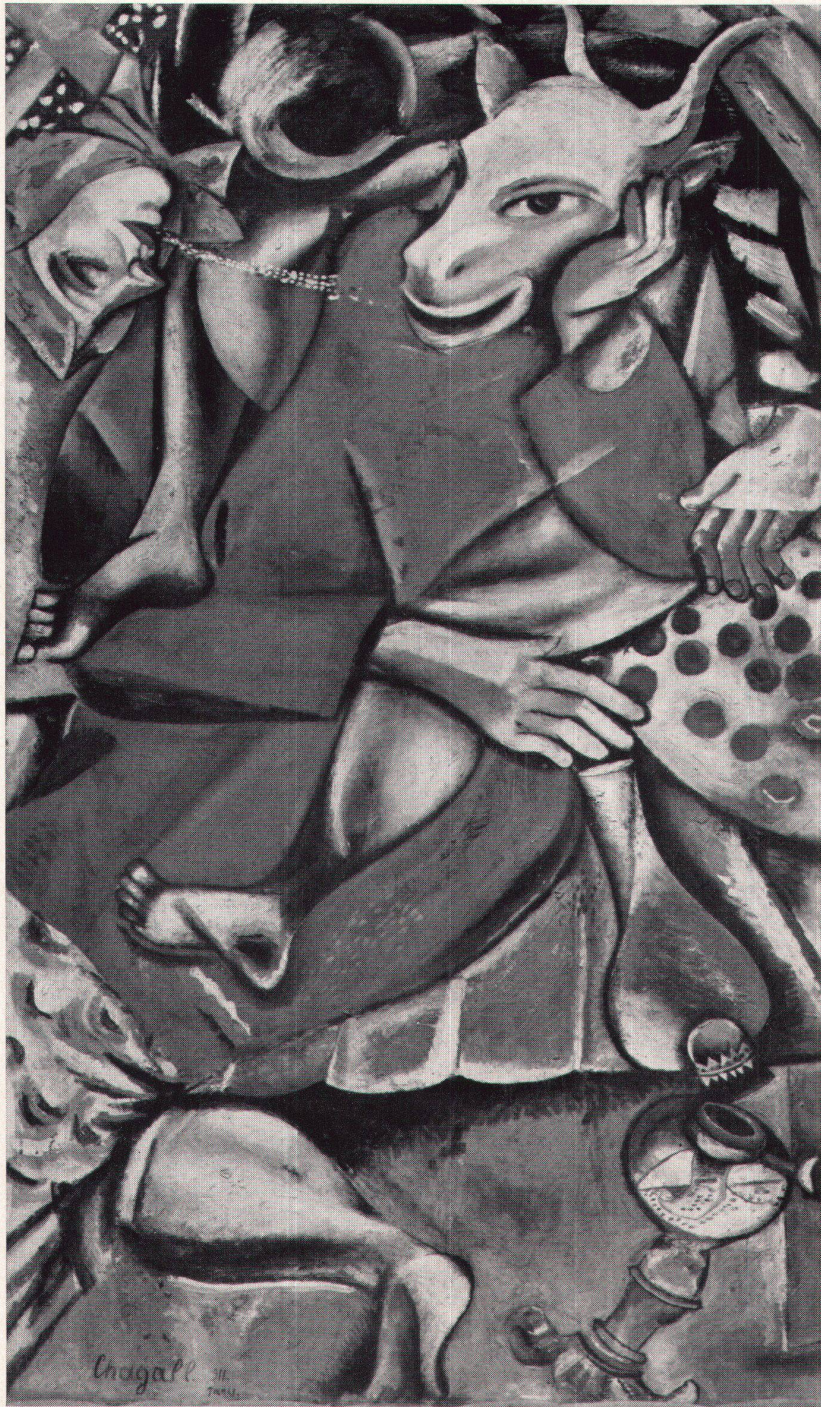
Marc Chagall, Dédicé à ma fiancée, 1911 Dedicated to my Fiancée

Stil, dionysisch auch im Gehalt – der Künstler soll das Bild in der Ekstase einer Nacht in der «Ruche» auf Montparnasse gemalt haben – schien das Werk dazu bestimmt, die Berner Sammlung vor einer einseitigen Orientierung nach dem ästhetischen Ideal Frankreichs zu bewahren – eine Haltung, zu der sie allein im Hinblick auf die ihr angegliederte Klee-Stiftung verpflichtet ist. Da es sich um ein Hauptwerk des Künstlers handelt, glaubten Konservator und Kommission die Erwerbung mit dem Abtausch des Bildes «Feiertag» von 1914 erleichtern zu dürfen, ein Vorgehen, das der Berichterstatter heute aufrichtig bedauert. Wertvolle Bilder, die einmal in eine öffentliche Sammlung eingegangen sind, sollen eben doch nicht preisgegeben werden, auch wenn damit eine qualitative Steigerung beabsichtigt und sogar erreicht wird. Zeitlich fortschreitend folgen auf das Bild von Chagall die «Jockeys» von Miró aus dem Jahr 1933 – charakteristisch humorvoll, im Ausmaß bedeutend und mehrere Facetten der beweglichen Kunst dieses Spaniers in sich vereinernd, darf auch diese Erwerbung als geglückt gelten – wohl mehr als die abstrakte Komposition Poliakoffs von 1957, deren einleuchtender Bau auf Kosten des farbigen Geheimnisses erreicht scheint.