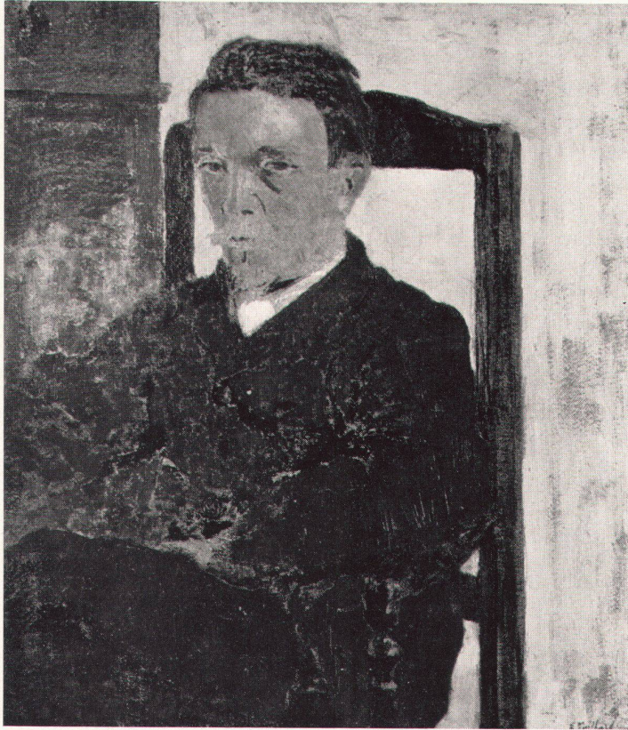
5 Edouard Vuillard, Bildnis Félix Vallotton, um 1900 Portrait de Félix Vallotton Portrait of Félix Vallotton