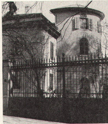
1 Das Haus «Zum Ehrenberg», vom Garten des Kunsthauses aus gesehen