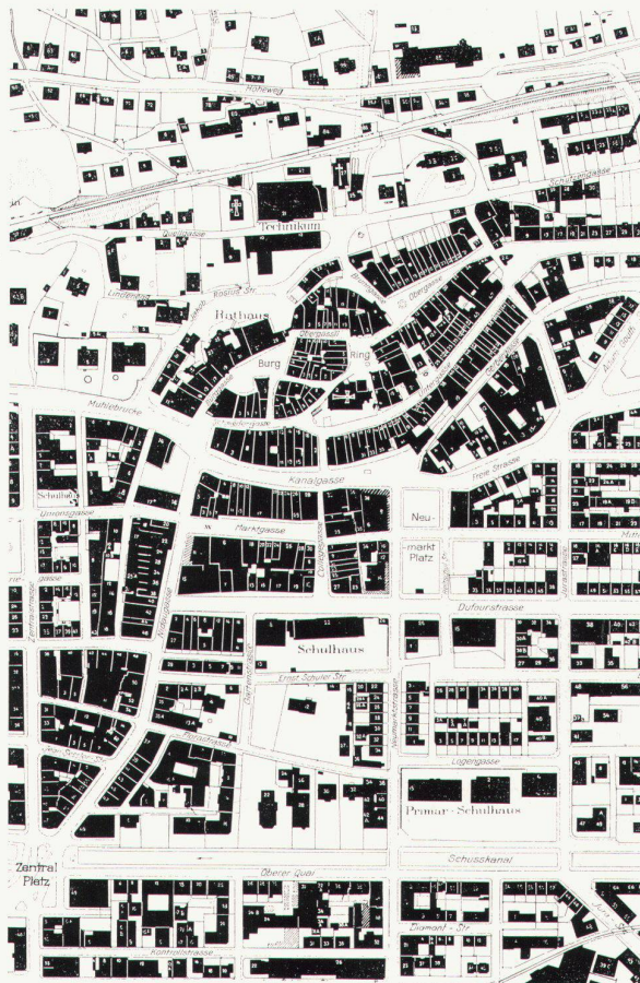
1 Plan von Biel. Deutlich hebt sich die Altstadt von der neuen Stadt ab Plan de Bienne. La vieille ville se distingue nettement de la nouvelle agglomération Bienne, plan. Old and new parts well discernible