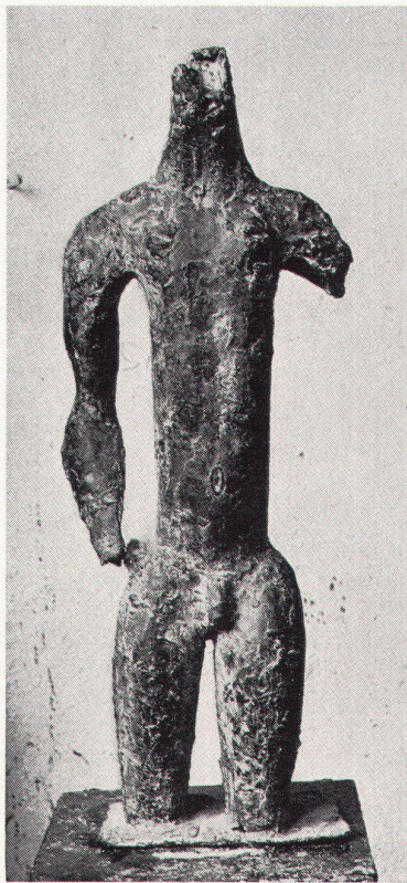
Toni Stadler, Knabentorso, 1960. Bronze

Les femmes dans l'œuvre de Picasso. C'est un thème qui pouvait être tentant, et c'est celui qu'a choisi la grande galerie lausannoise pour présenter en ces deux derniers mois de l'année une fort belle sélection de gravures du peintre de «Guernica». Il s'agit d'une quarantaine de planches à tirage limité, où se re-