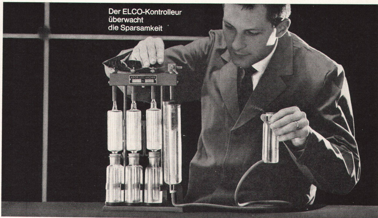
Der ELCO-Kontrolleur überwacht die Sparsamkeit

Bevor ein ELCO-Oelbrenner das Werk verlässt, wird er im Prüfstand einer exakten Schlusskontrolle unterzogen. Eine Phase daraus sehen Sie auf dem Bild! Die Rauchgas-Analyse mit dem CO 2 -Prüfgerät. Damit wird der ELCO-Brenner auf sparsamste Verbrennung einreguliert. — Die Schlusskontrolle gibt Ihnen und uns