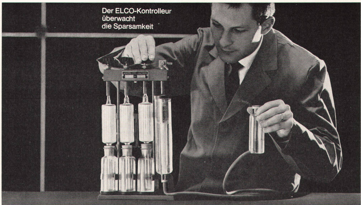
Der ELCO-Kontrollleur überwacht die Sparsamkeit

Bevor ein ELCO-Oelbrenner das Werk verlässt, wird er im Prüfstand einer exakten Schlusskontrolle unterzogen. Eine Phase daraus sehen Sie auf dem Bild! Die Rauchgas-Analyse mit dem CO 2 -Prüfgerät. Damit wird der ELCO-Brenner auf sparsamste Verbrennung einreguliert. — Die Schlusskontrolle gibt Ihnen und uns