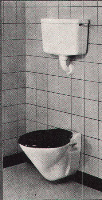
GEBERIT-PVC-Spülkasten Nr. 10.000, mit GEBERIT- Spülrohranschlussbogen 1 1/2", Nr. 44.009, 2teiliges Unterputz- Polyäthylen-Spülrohr Nr. 44.260, Anschlussgarnitur Nr. 49.300 für an der Wand befestigtes Klosett