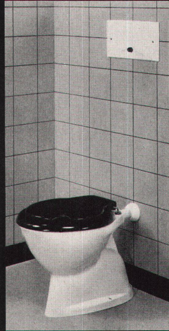
GEBERIT-PVC-Spülkasten für Wandeinbau Nr. 15.000, mit Spülrohranschlussgarnitur Nr. 44.212 für am Boden befestigtes Klosett