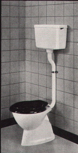
GEBERIT-PVC-Spülkasten Nr. 10.000, mit Spülrohr 2" x 1 1/2", Länge 70 x 22 cm, Nr. 44.020 für am Boden befestigtes Klosett