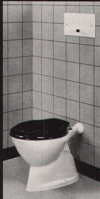
GEBERIT-PVC-Spülkasten für Wandeinbau Nr. 15.000, mit Spülrohranschlussgarnitur Nr. 44.212 für am Boden befestigtes Klosett