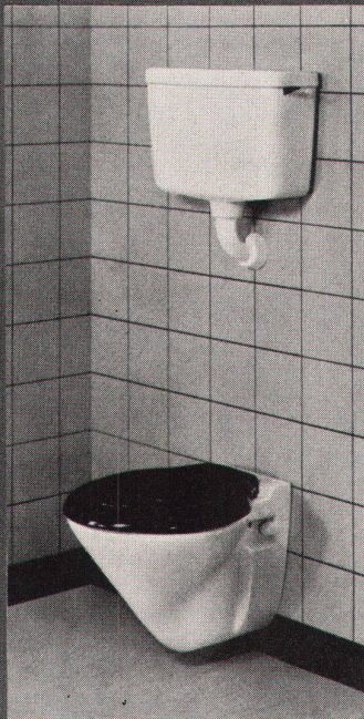
GEBERIT-PVC-Spülkasten Nr. 10.000, mit GEBERIT- Spülrohranschlussbogen 1 1/2", Nr. 44.009, 2teiliges Unterputz- Polyaethylen-Spülrohr Nr. 44.260, Anschlussgarnitur Nr. 49.300 für an der Wand befestigtes Klosett