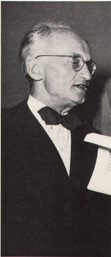
Dr. Franz Roh

der strengen Formanalyse und der undogmatischen Betrachtung der Kunstentwicklung als eines notwendigen biologischen Ablaufs mit. Aus Eigenem gab er eine nie erlahmende wache Aufmerksamkeit und stete Bereitschaft zur Stellungnahme hinzu. Roh war es, der 1925 den Begriff «Magischer Realismus» prägte; er erkannte auch früh die moderne experimentelle Photographie als Kunst. Seine Unbefangenheit gegenüber ästhetischen Dogmen führte ihn dazu, die Geschichte des kulturellen Mißverstehens («Der verkannte Künstler», 1948), der Kunstbarbarei im Dritten Reich («Entartete Kunst», 1962) und des «Streites um die moderne Kunst» (1962) zu schreiben. Rohs Tätigkeit dehnt sich auch auf leitende und beratende Mitwirkung in Kommissionen und Vereinigungen zur Pflege der Kunst aus; er beschäftigt sich mit absoluter Musik und schafft Collagen surrealistischer Prägung, die in der letzten Zeit immer breitere Beachtung durch die Kunstfreunde finden. Wir wünschen Franz Roh weiterhin ein ausgebreitetes Wirken und reichen inneren Ertrag aus seinen Aktivitäten.