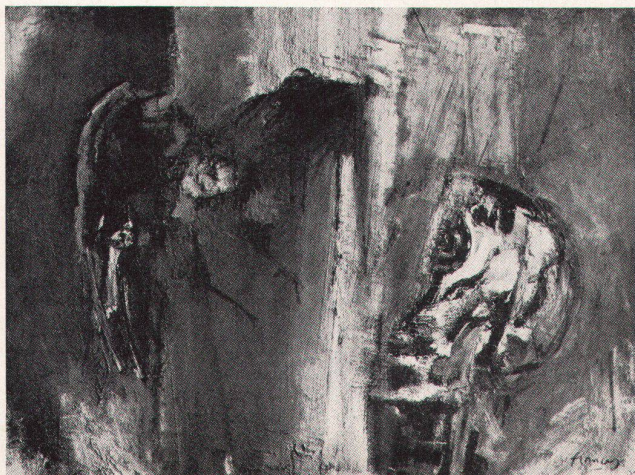
3 Franco Francese, Der Vogel schlägt ans Fenster, 1961