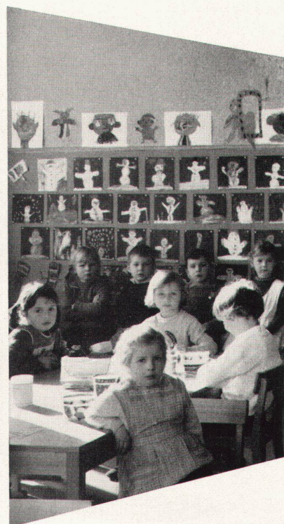
Mobiliar für Kindergärten

mit der 10-Jahres-Garantie für dauerhaften Schreibbelag und den Vorteilen: Angenehmes, weiches, blendungsfreies Schreiben und Zeichnen auf graugrün und schattenschwarzen, magnethaftenden und kratzfesten Flächen, die leicht zu reinigen sind.