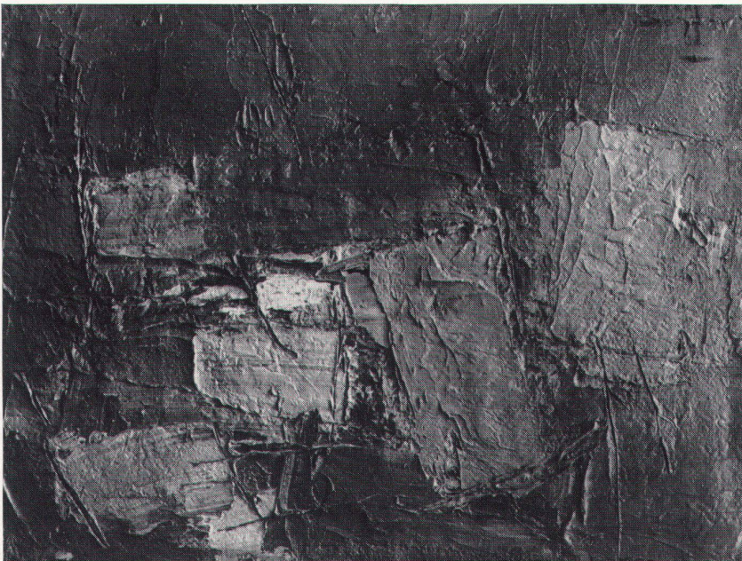
Edmondo Dobrzanski, Steine im Meer, 1962 Pierres dans la mer Stones in the Sea

Farbe, die sich ausbreitet und verdichtet, die zum Kern hindrängt», unterstreicht der Künstler.