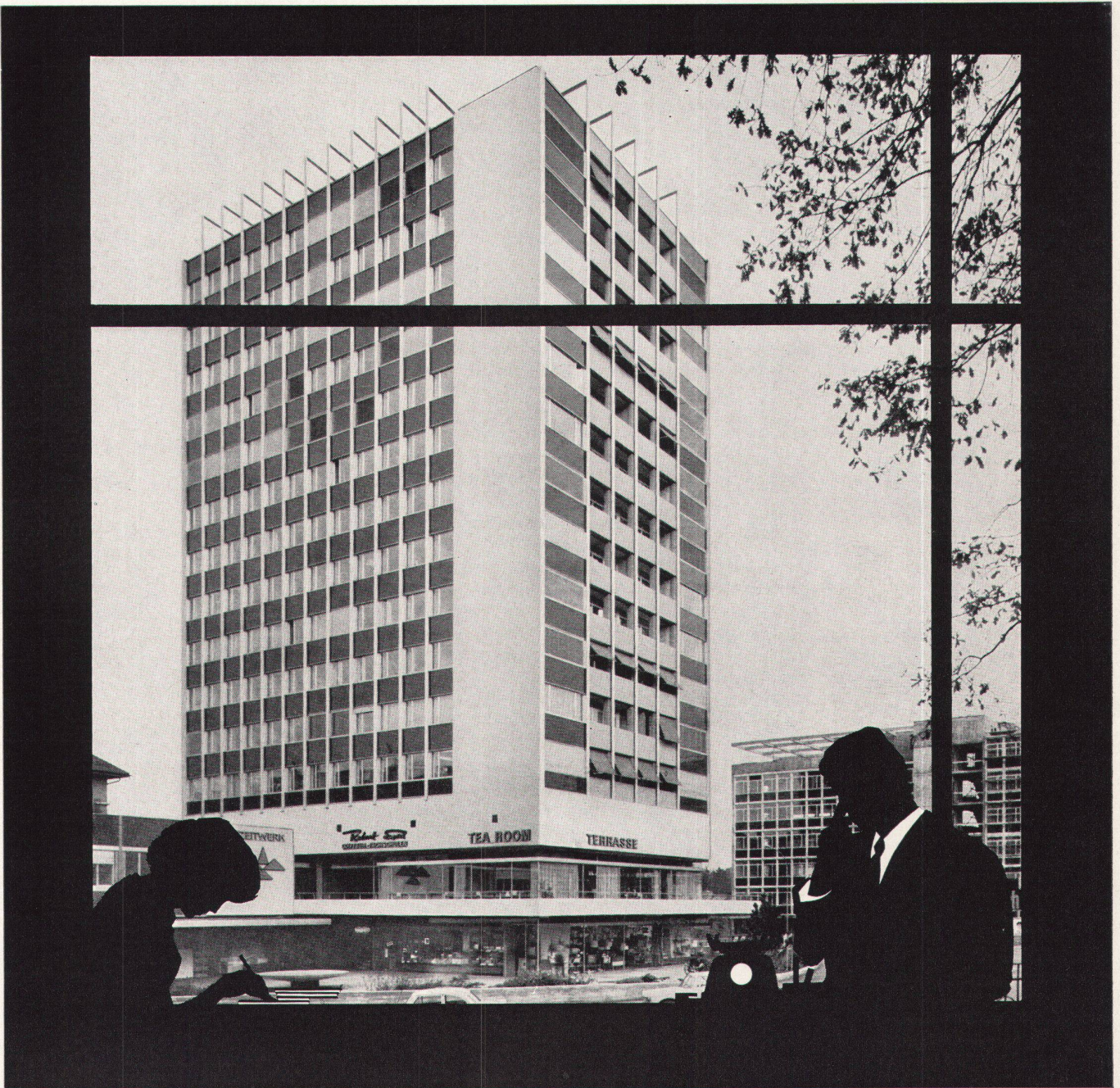
Hochhaus am Eigerplatz, Bern: Verschiedene Lüftungsanlagen der WERA AG