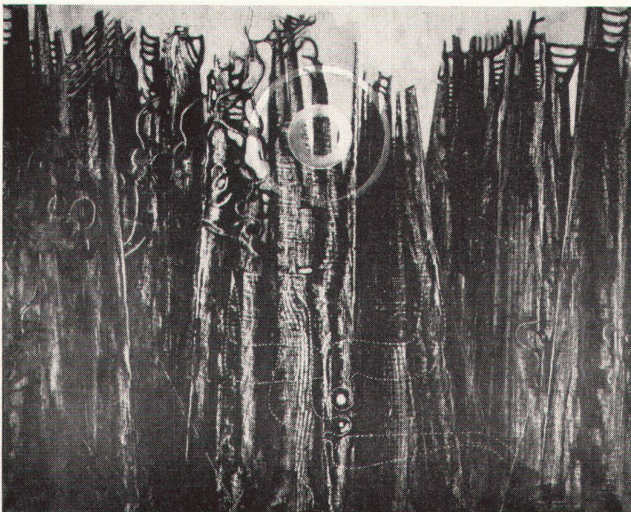
Max Ernst, Forêt, oiseau, soleil, 1927. Aus der Ausstellung der Galerie d'Art Moderne, Basel

Seltsam nur, daß sich bei aller Bewunderung für Konstruktion und Kombination nur ganz selten ein künstlerisches Erlebnis einstellt; ein Erlebnis – ans Lebende