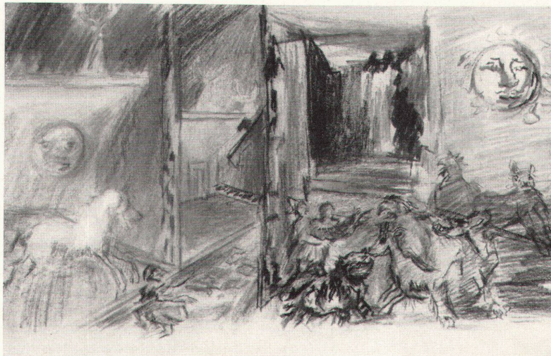
Oskar Kokoschka, Projet de décor pour «La Flûte enchantée», II e acte, 2 e tableau