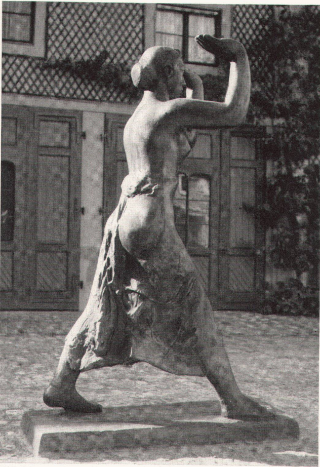
Jakob Probst, Landmädchen, 1930. Bronze