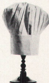
Personal-Restaurant Maschinenfabrik Rüti