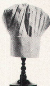
Imbiss-Ecke des Konsumvereins Kloten