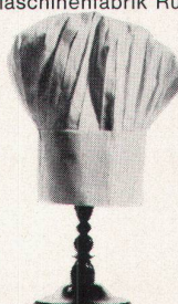
Restaurant Parkhaus Zürich