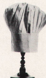
Mövenpick Ueberland Zürich