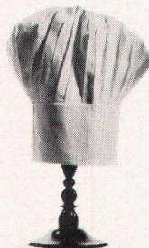
Restaurant Bayerischer Rundfunk München