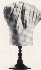
Restaurant Terrasse Zürich