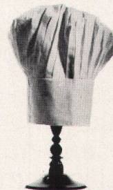
Cafeteria Bahnhofbuffet Zürich HB