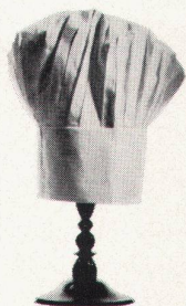
Personal-Restaurant der Firma Dätwyler Altdorf

Wo STEINER ein neues Personalrestaurant einrichtet, ist der Küchenchef so begeistert, dass er eine neue Standeskrone anschafft, wie zum Beispiel hier: