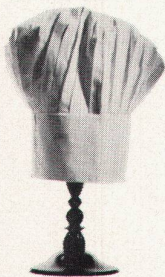
Personal-Restaurant der Eidgen. Versicherung Zürich