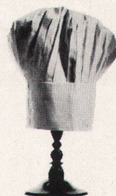
Restaurant Steinbock Chur