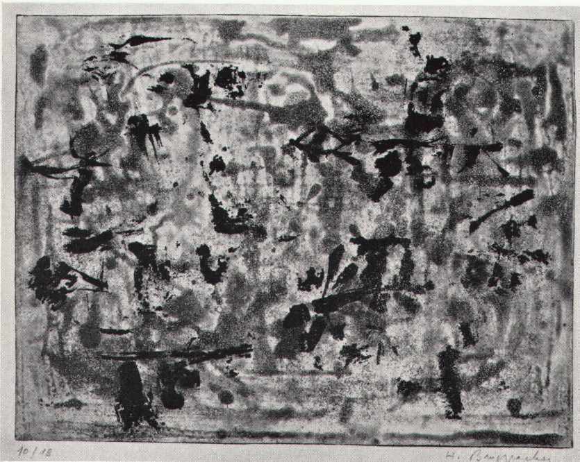
6 Heinrich Bruppacher, Schwarze Zeichen auf bewegtem Grund , 1964 Signes noirs sur fond mouvementé. Aquatinte Black signs on animated ground. Aquatint