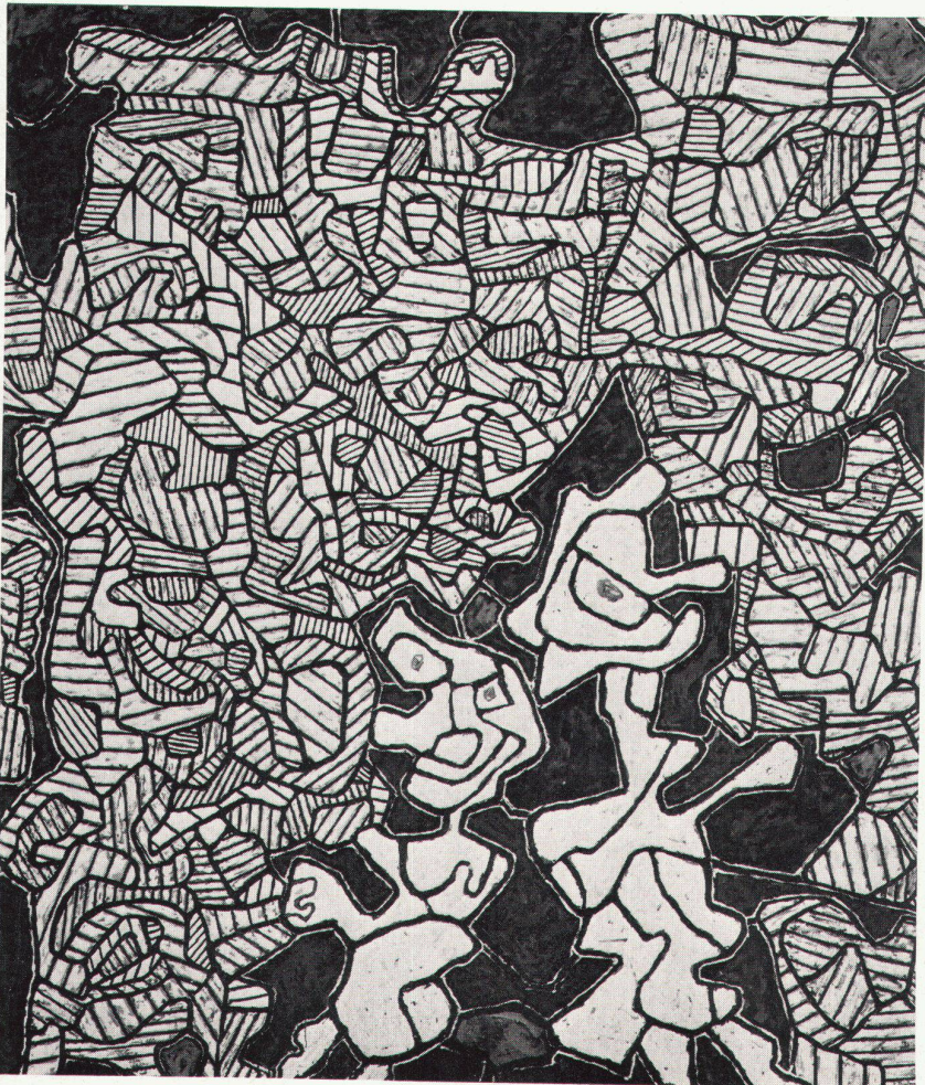
2 Jean Dubuffet, Château l'Hourloupe, 1963. Galerie Beyeler, Basel