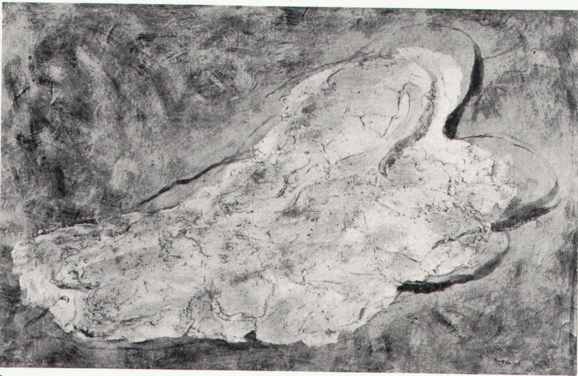
1 Jean Fautrier, La juive, 1945