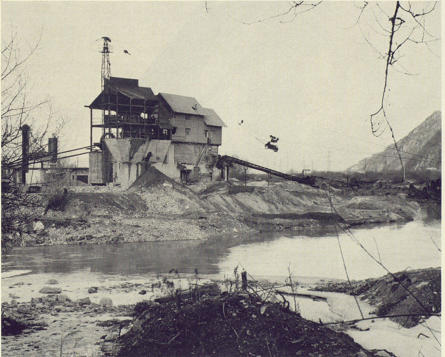
Rhone-Kieswerk Riddes, Wallis, gebaut 1940. Produktion von Granitkieseln, gewaschenem Sand und Fertigbeton

Was wir heute als geschulte Architekten im Industriebau leisten können, sind Wachstumsplanung und Verpackung. Beides sind gedachte, gewollte Formspiele, die nichts mehr gemeinsam haben mit der alten Zufallsarchitektur. Zufall ist ja der Gegenpol zur Planung. Und deshalb ist es richtig und erklärlich, daß wir den alten schönen Industriebauten nachtrauern, die wir punkto Spontaneität nie mehr nachahmen und verbessern werden können. Es ist eine vergangene Welt von einer Naivität und Kühnheit, die wir nicht mehr haben.