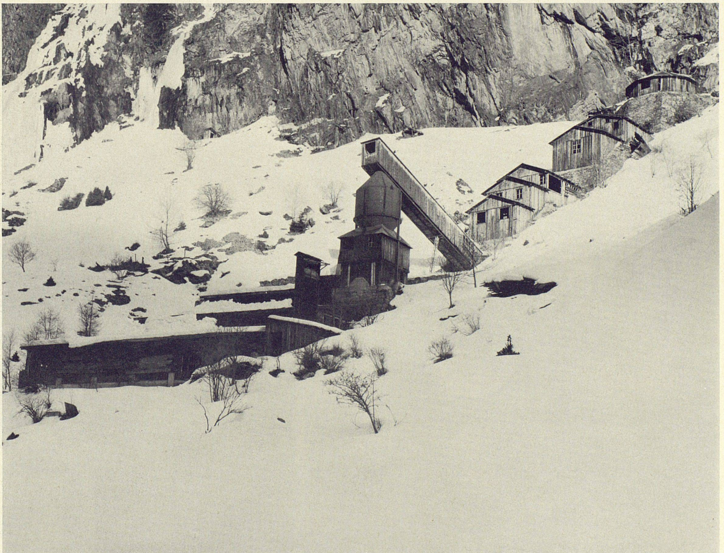
Blei- und Zinkmine Goppenstein Wallis; erstes geologisches Projekt 1930 H. F. Huttenlocher, Bern. Heute sichtbare Installation 1944 erbaut durch J. Dionisotti; Abbruch der Ausbeutung 1946

A world is gone. We are not going to have any more.