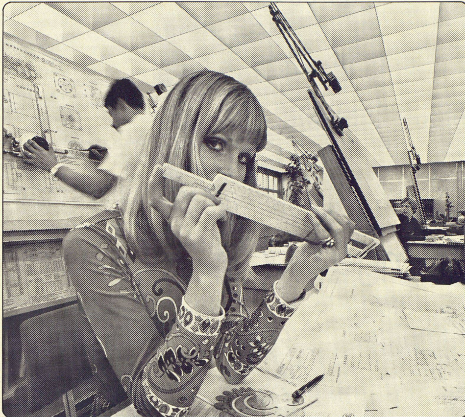
Aufnahme im Grossraumbüro der SIG, Neuhausen am Rheinfl.