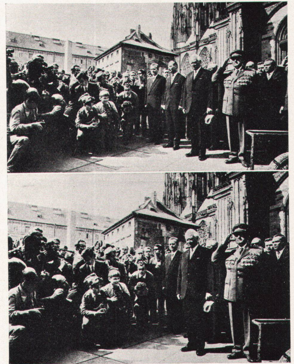
1 Es ist ein Fuß, sonst nichts. Während des «Prager Frühlings» vom Volke enthusiastisch gefeiert, wird Parteisekretär Alexander Dubcek nach der sowjetischen Panzerokkupation zur Orwellschen «Unperson». Selbst aus historischen Photodokumenten muß sein Konterfei verschwinden.