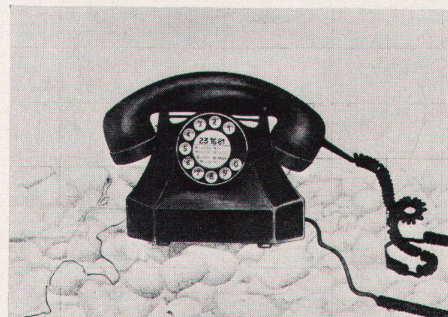
1 Hans Schweizer, Strandtelefon, 1971. Radierung

In der Galerie dibi dabi machte Hans Schweizer Inventur: eine Nähmaschine, ein Bügeleisen, ein Telephonapparat, ein Mantel, eine Vitrine voll Orden, vor allem Schuhe. Alle getragen, ausgegient, weggestellt, weggeworfen. Entdeckt von Hans Schweizer auf dem Kiesstrand der Normandie oder auf dem heimatischen Holzrost. Plötzlich zeigen die eingemotteten oder arg mitgenommenen Gegenstände ihr wahres Gesicht, ihre eigentliche Natur, ihr Innenleben. Sie faszinieren den Finder. Denn die kargen Dinge haben eine Geschichte, sie erzählen, daß sie aus verschiedenen Gründen so geworden sind. Es handelt sich weniger um Natures mortes als vielmehr um Stilleben unserer raschlebigen Zeit. Die scheinbar toten Objekte bezeugen das Leben.