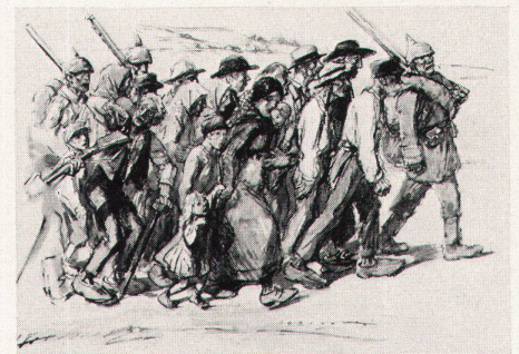
1 Théophile-Alexandre Steinlen, L'Exode, 1915. Aquarell

Auch der zweite von der Kunsthalle vorgestellte Künstler gehört in die Kategorie der berufsmäßigen Lieferanten von Bildmaterial. Allerdings in einem ganz anderen Sinne als der «Déserteur». Théophile-Alexandre Steinlen war seit den achtziger Jahren des letzten Jahrhunderts, bis zu seinem Tode, 1923, in Paris tätig. Er versuchte sich im Gegensatz zu «Le Déserteur» in allen damals modernen Techniken der Graphik und der Illustration und ist einzureihen unter die französischen Gesellschaftskritiker des Fin de siècle. Allerdings unterscheidet er sich in seinen schärfsten – und einzig gelungenen – Satiren deutlich von den Künstlern des Fachs: etwa Constantin Guys, Dau-