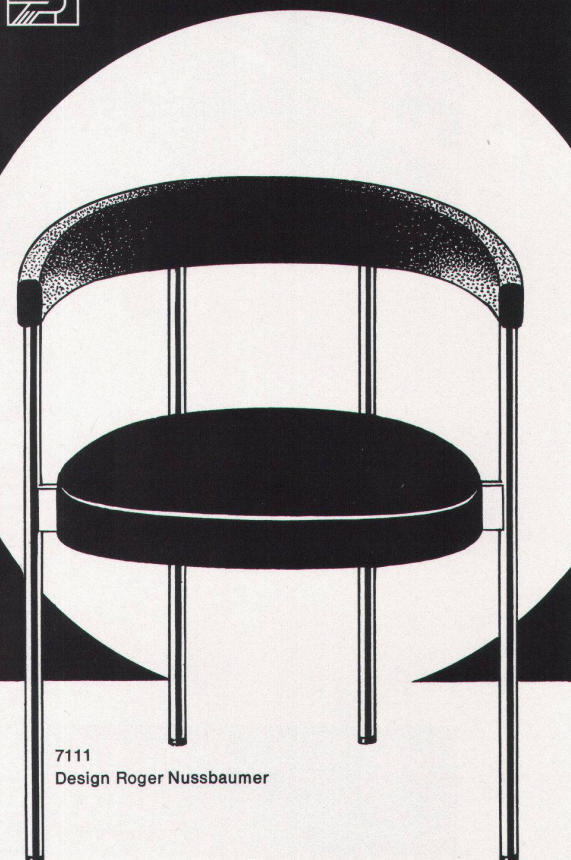
7111 Design Roger Nussbaumer