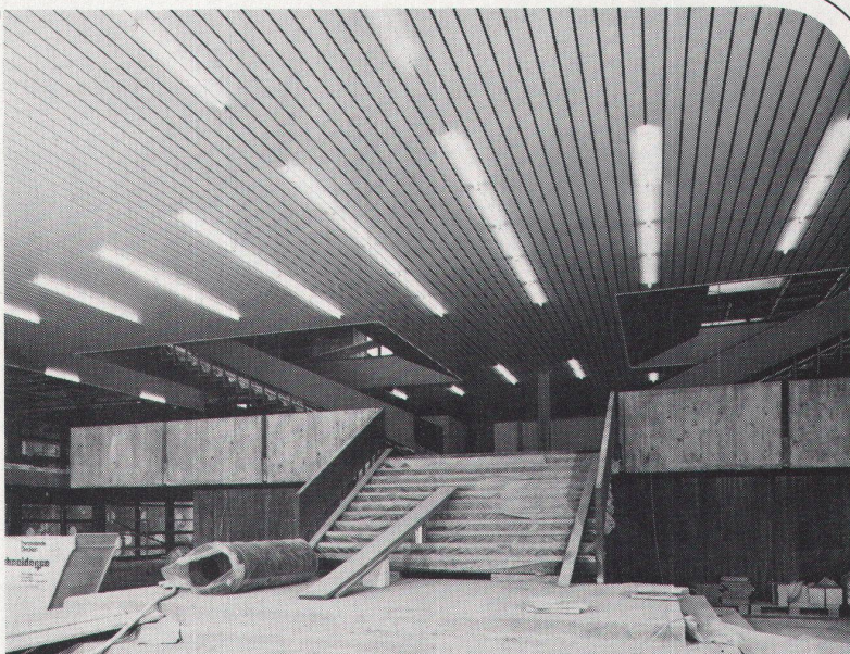
Technikum Rapperswil, LUXALON ® -Panneeldecke Typ 134 H

Besser gesagt, weil LUXALON ® -Aluminiumdecken die bessere Lösung sind. Als dekorative Akustik- und Lüftungsdecken. Weil sie hohe Korrosionsfestigkeit bieten, weil sie schnell montiert werden können, weil sie ideale Gestaltungsmöglichkeiten bieten, weil Leitungen und Installationen immer zugänglich bleiben.